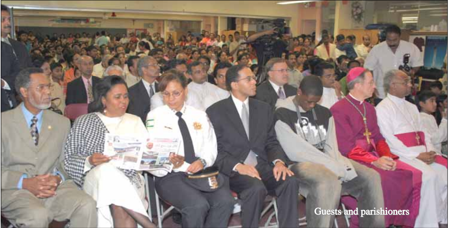
Guests and parishioners