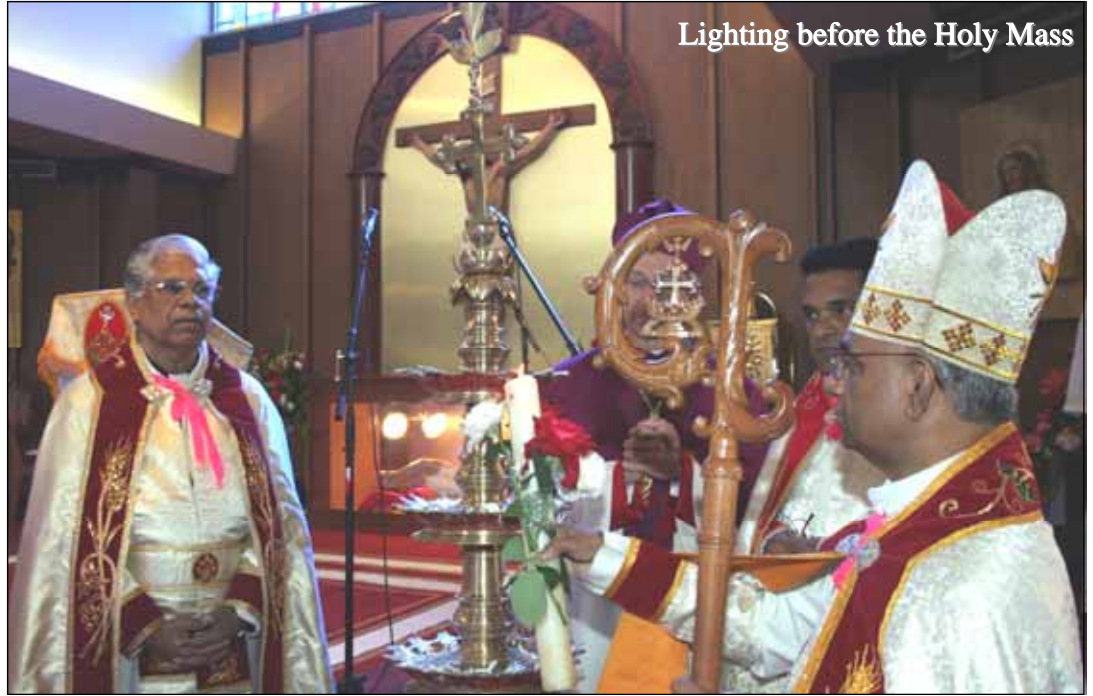
Lighting before the Holy Mass