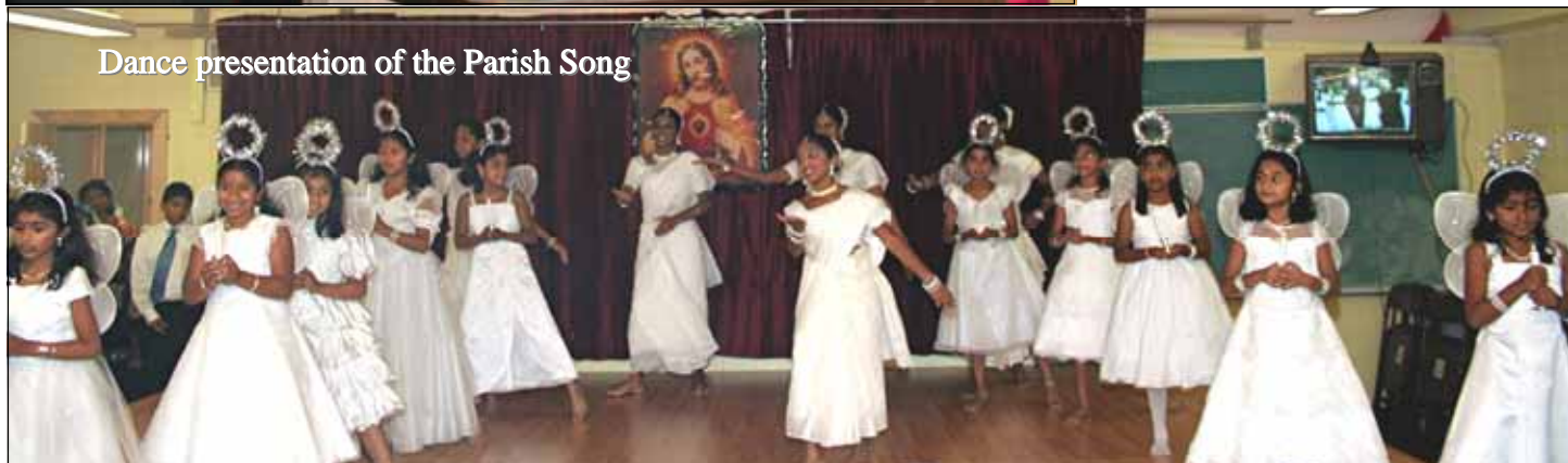
Dance presentation of the Parish Song

Please support our advertisers who make this bulletin available for us.