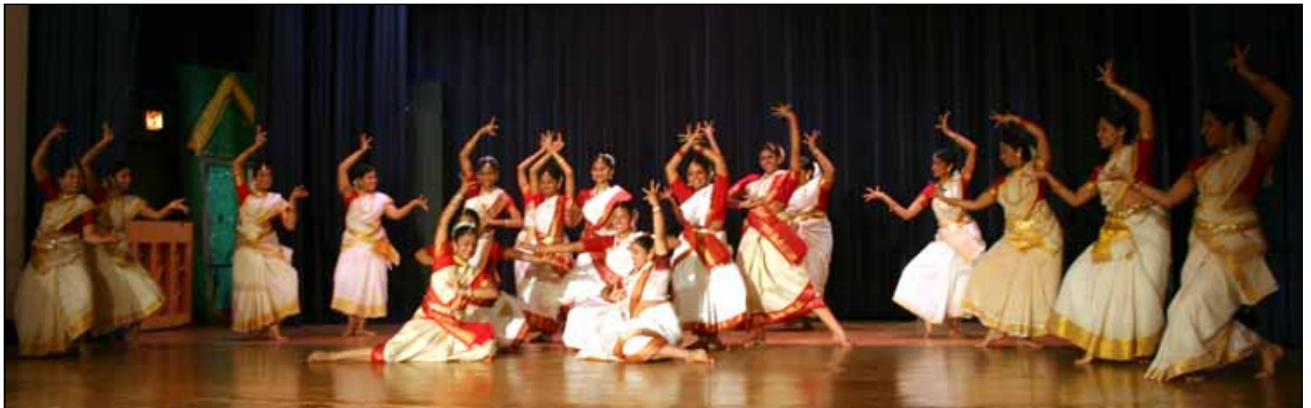
സ്വാഗത നൃത്തം: മൂന്നാം ഭാഗം