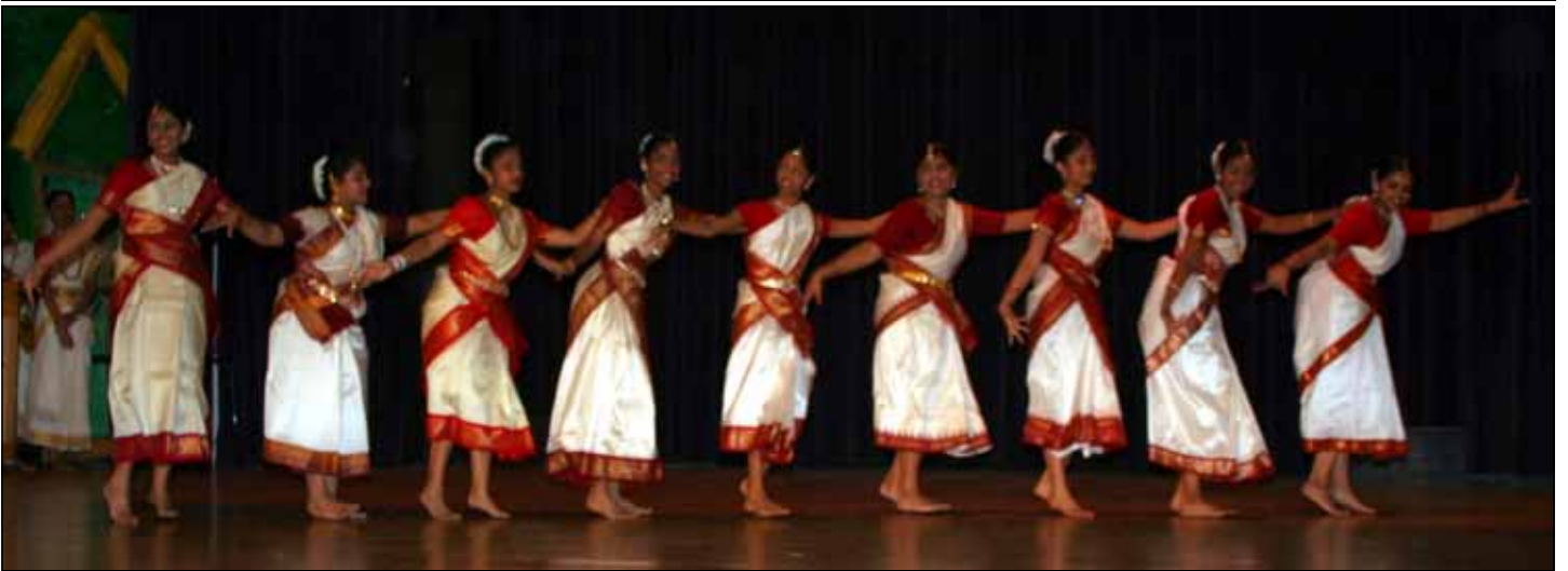
സ്വാഗത നൃത്തം: രണ്ടാം ഭാഗം