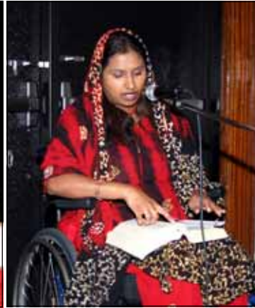
ഒന്നാം വായന: ജോമോൾ ചിറയത്തിൽ