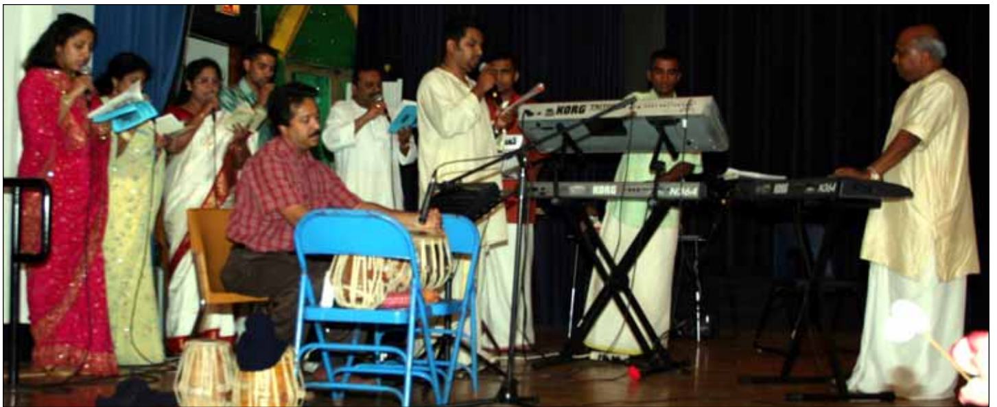
ചിക്കാഗോ ക്നാനായ കാത്തലിക് മിഷന്റെ ഗായക സംഘം