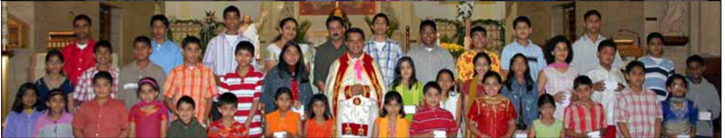
Recipients of Perfect Attendance Award at Addison (top) and OLV Chicago.