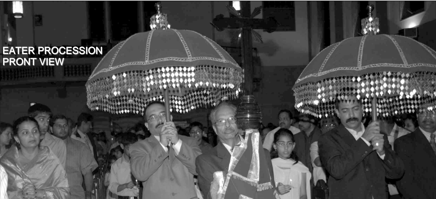
EASTER PROCESSION PRONT VIEW