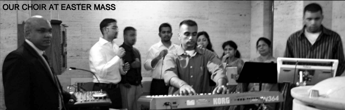
OUR CHOIR AT EASTER MASS