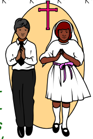
Easter Mass of the Mission at OLV Chicago

The Knanaya Catholic Mission - Chicago, along with the students and parents of the recipients of First Holy Communion and Chrismation invites you and your family to participate in the liturgical functions from 3:30 P.M. at St. John Brebeuf Church, 8307 N. Harlem Ave, Niles, IL 60714 and for the banquet at 6:30 P.M. at White Eagle Banquet Halls, 6845 N. Milwaukee Ave, Niles, IL 60714.