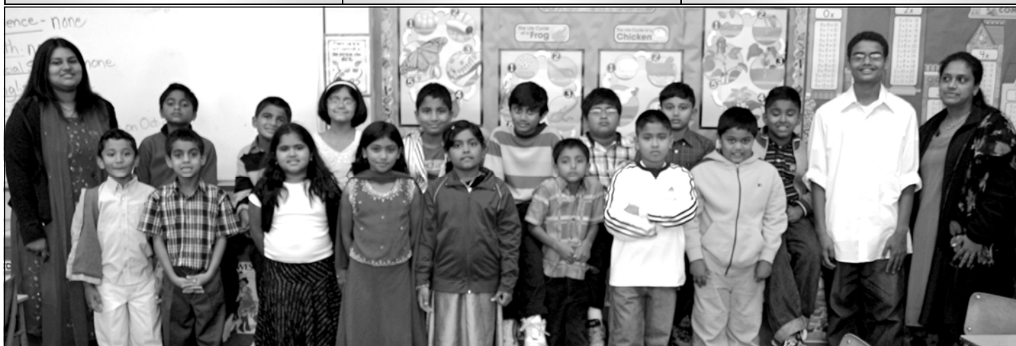
Students and teachers of Third Grade in the Religious Education School at Addison.