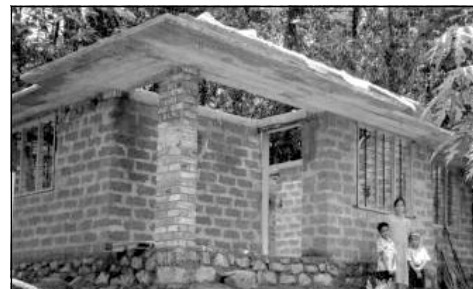
A house under construction supported by Agape Movement.

18.3 DONOR SUGGESTED PROJECTS: If a donor requests to support with his or her contribution a particular individual, organization, or institution and if it is according to the ideology of Agape Movement, it will be considered. In such instances, if Agape Movement India office cannot keep in touch with the recipients, the donor will have to contact them directly to track the progress of the project and to receive the reports and photographs.