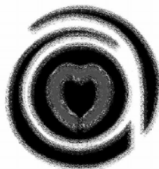
Emblem of Agape Movement

The property of this corporation is irrevocably dedicated to charitable and religious purposes and no part of the net income or assets of this corporation shall ever inure to the