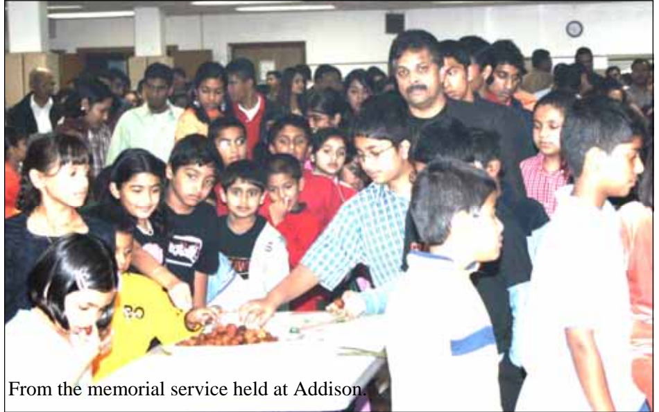
From the memorial service held at Addison.