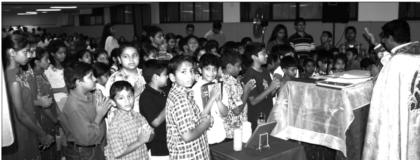
Blessing of Religious Education Students in Addison after the installation of teachers.