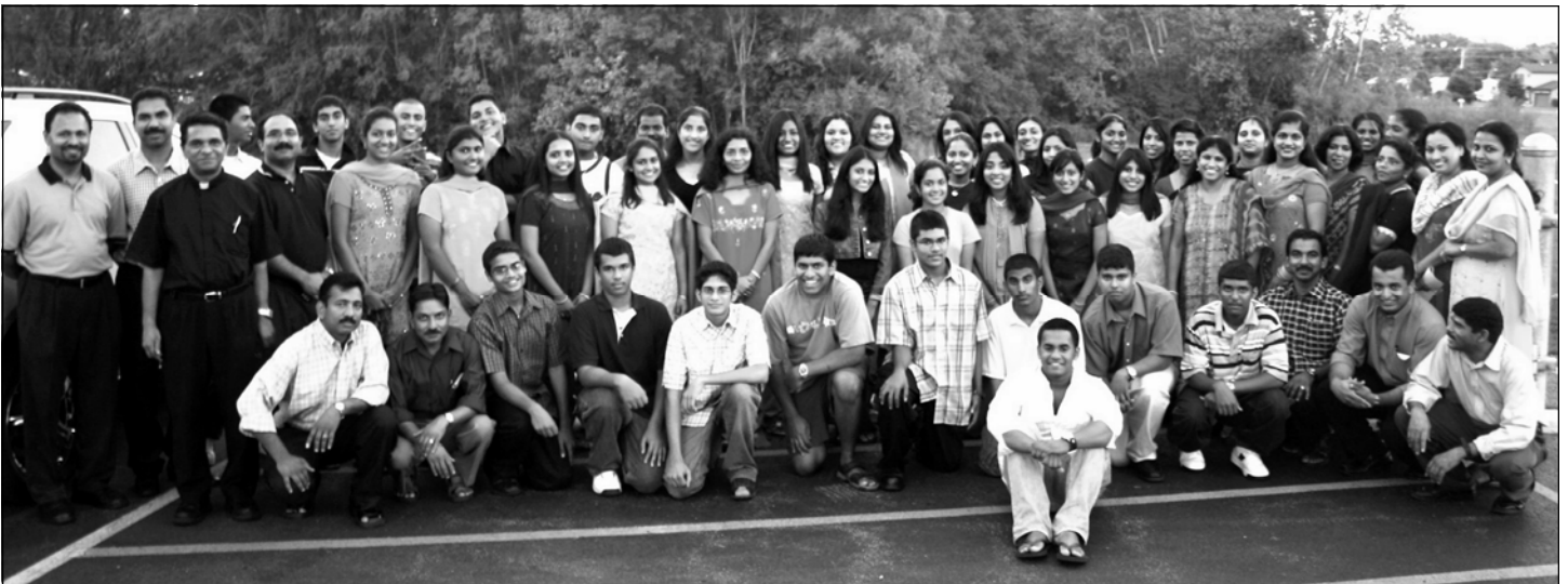
Some of our religious education staff and adult volunteers when they gathered in Addison for teachers' training program