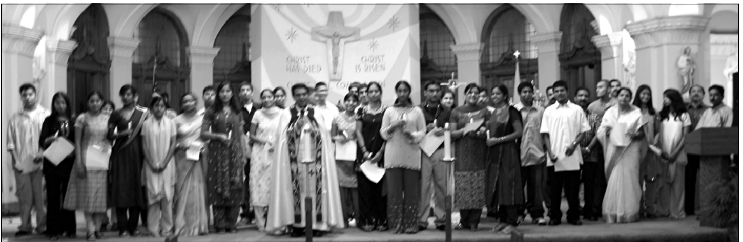
Religious Education Teachers and volunteers at OLV Chicago during their installation service at the church.