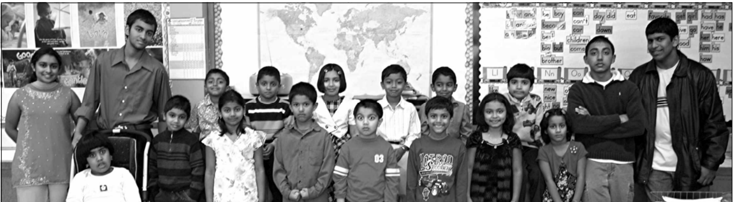
Students and teachers of First Grade in the Religious Education School at Addison.

Please support our advertisers who make this bulletin available for us. Limited space is available for Classified Advertisements.