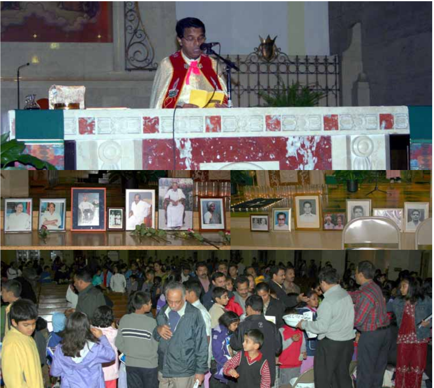
Scenes from the memorial service for all souls held at OLV Church on November 13, 2005.