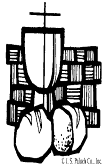
C.I.S. Palach Co., Inc.